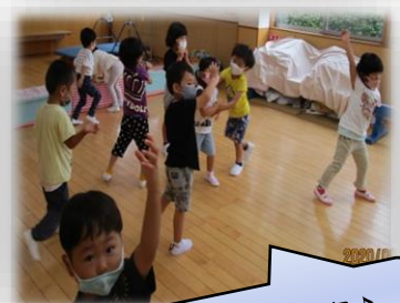
初めてのリトミック♪